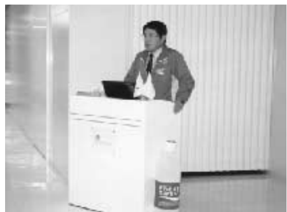
大塚製薬(株) 袋井工場