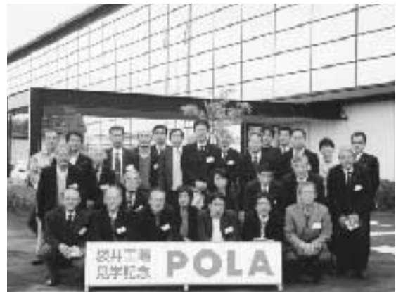
ポーラ化成工業(株) 袋井工場